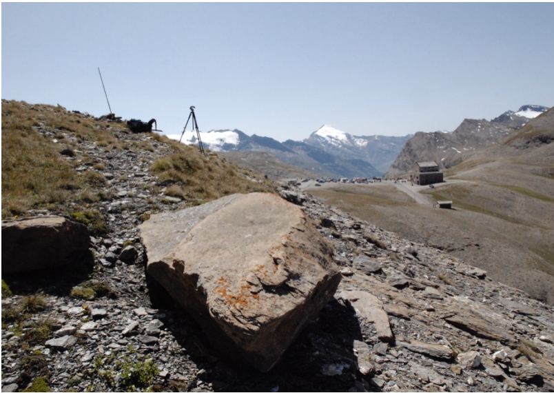
État du lieu de prise de vue en 2011