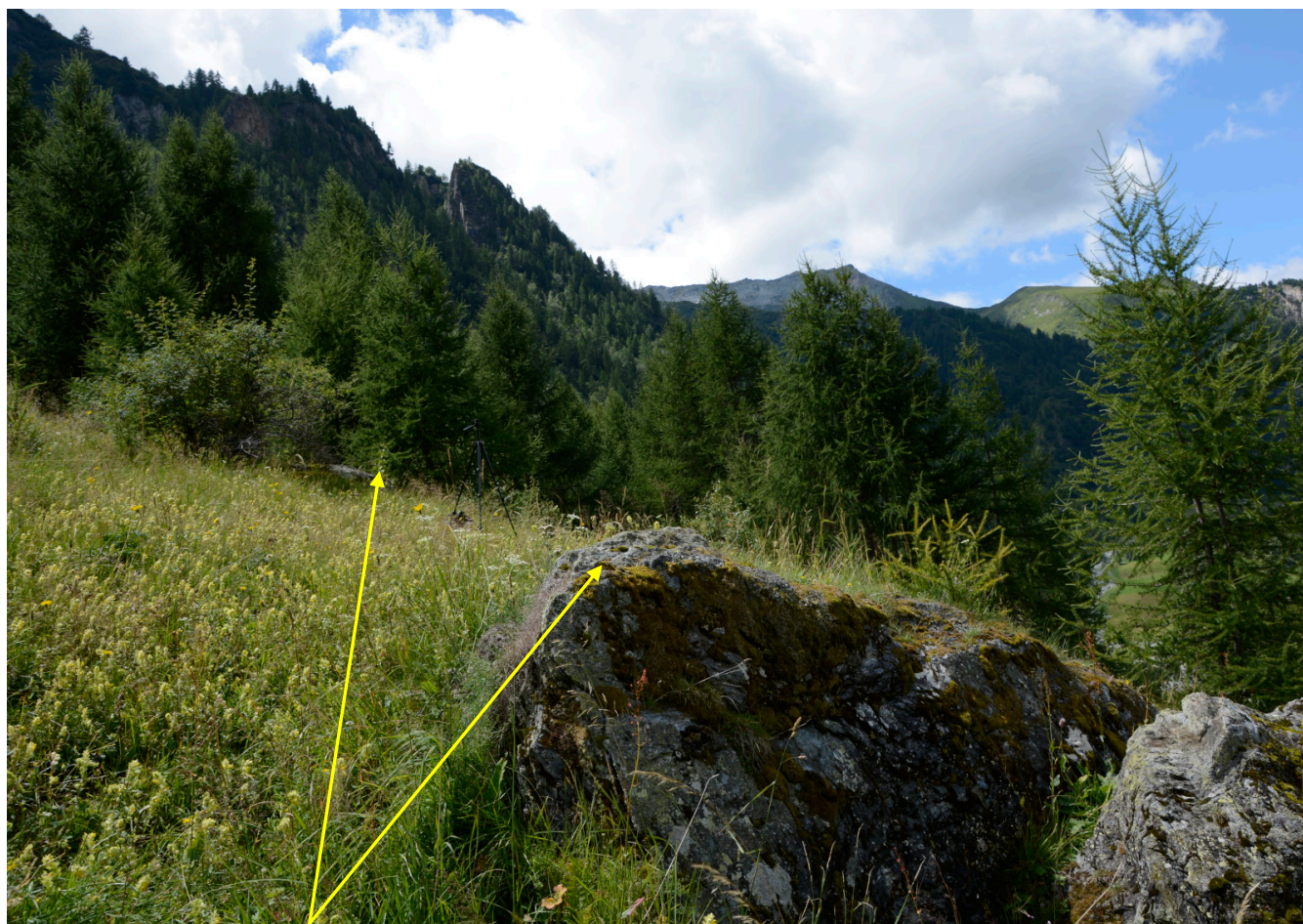
Rochers décrits sur le croquis en page 1